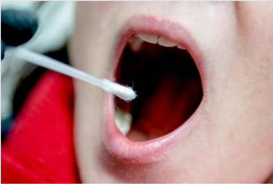
CORONA 3G-Kontrolle am Arbeitsplatz endet