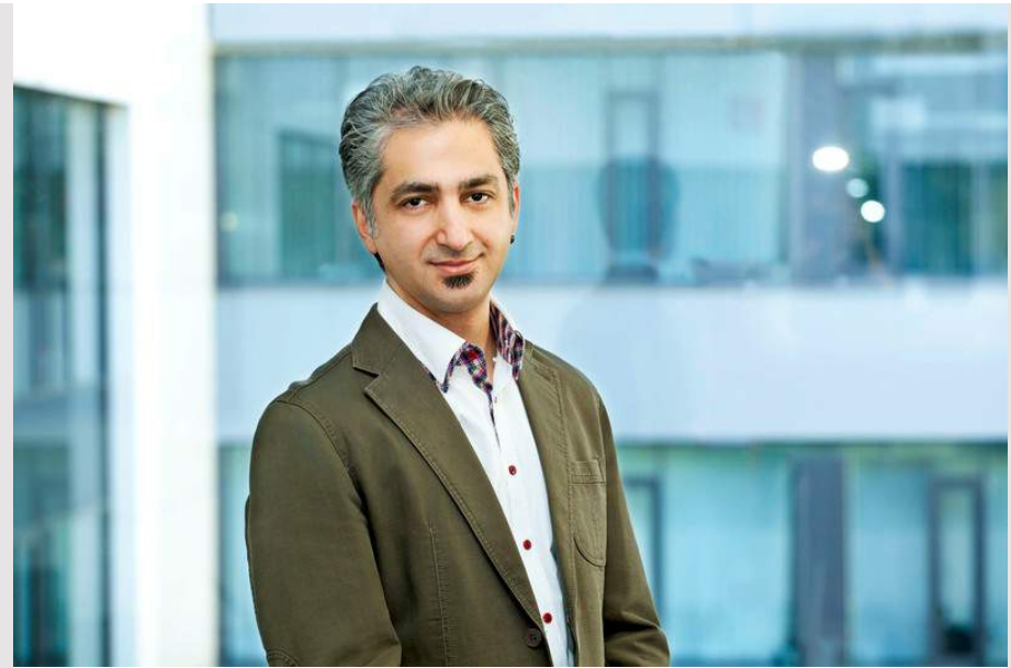
IT-SICHERHEIT Erfolgreiche Bilanz der RUB auf der Konferenz CHES 2021