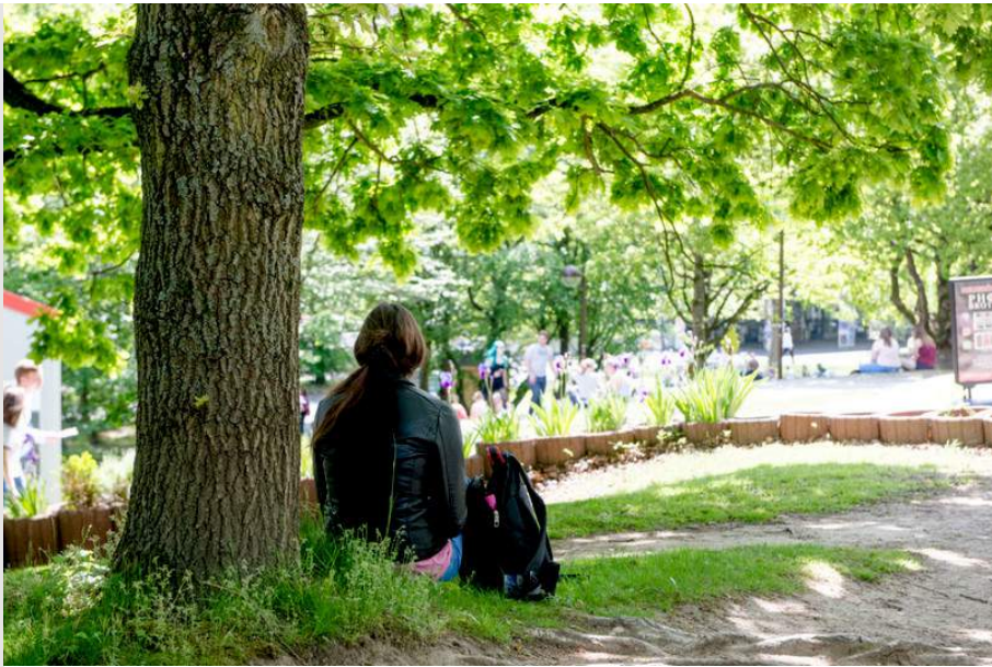
WINTERSEMESTER 2021/22 Wiedersehen auf dem Campus